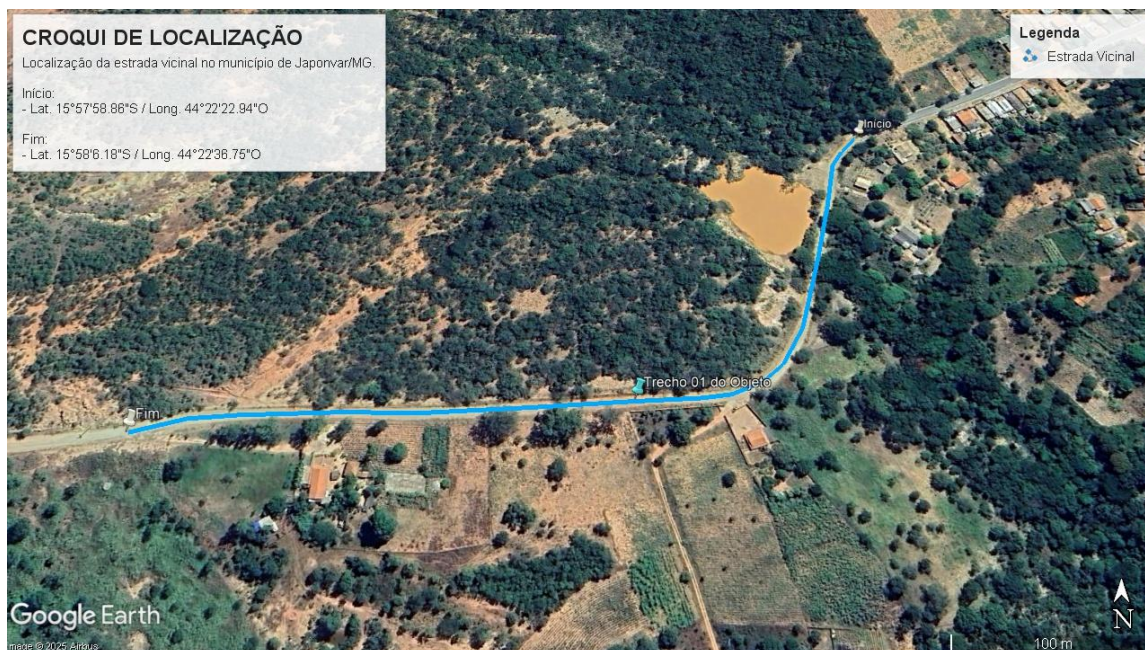
Imagem: Croqui de localização da via.